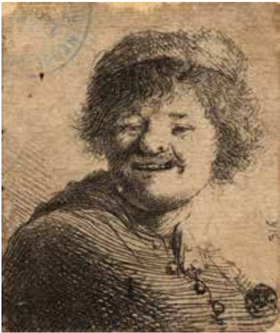
© Rembrandt riant , Rembrandt, BML