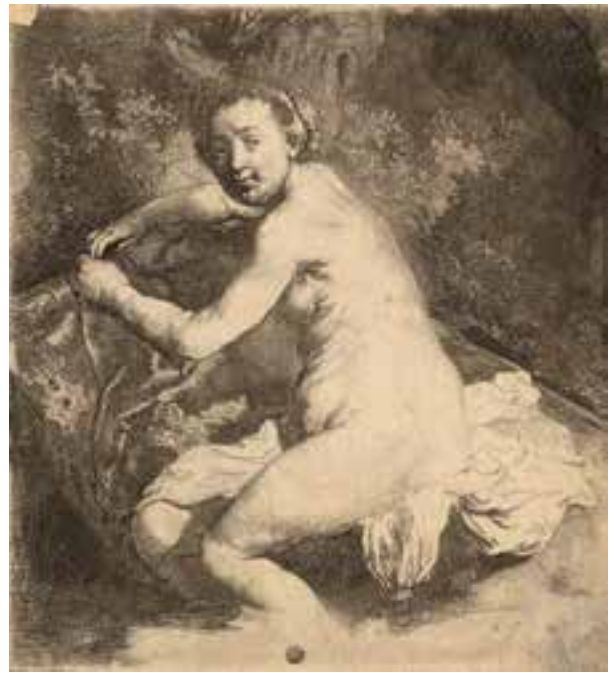
© Diane au bain , Rembrandt, BML