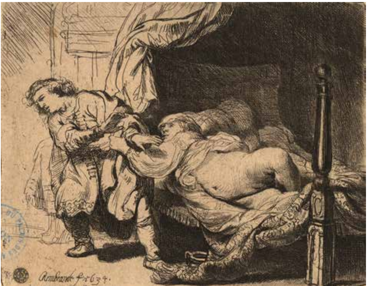
© Joseph et la femme de Putiphar , Rembrandt, BML